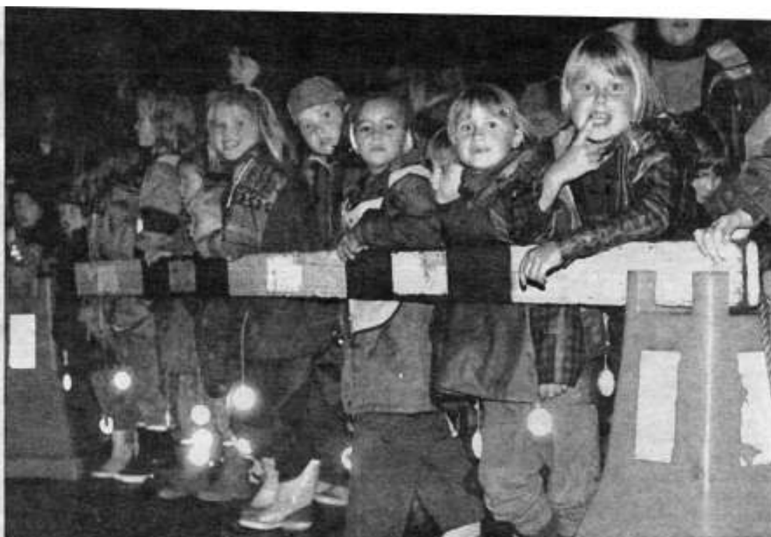
MANGE: Nærmere 400 foreldre, førsteklasinger og seksåringer var med på årets refleksaksjon som ble avholdt på Steinrusten mandag og tirsdag.

Å forebygge ulykker er et arbeid Norsk Folkehjelp prioriterer. I trafikksikringsarbeid hadde vi årlige reflekskampanjer som et av bidragene. I 1989 fikk vi 3750 refleksbrikker fra forskjellige bedrifter, og størstedelen av refleksbrikkene ble delt ut til personer som befant seg ute på høstmørke Askøyveier. Dessuten fikk skoler og barnehager også utdelt reflekser fra Norsk Folkehjelp Askøy. Dette har vi gjort i en del år. Vi har også i samarbeid med Trygg Trafikk, Krokås og Heimli trafikkskoler, Vest Trafikk og Motorførernes Avholdsforbund på Askøy vært med å arrangere refleksaksjon på Steinrustveien. Der fikk alle 1 klassingene på Askøy se hvor vanskelig det var å se folk som gikk uten refleks.